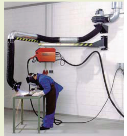
Imupuomi (tuotenro. 97 641)